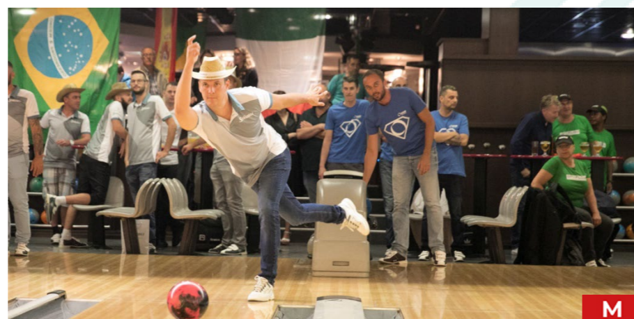
Tournoi mixte. Équipe de 4 joueurs.