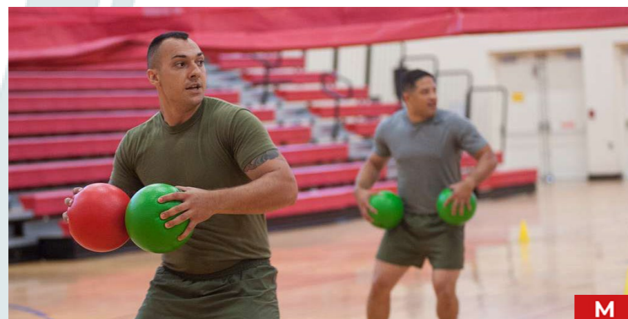
Tournoi mixte. Équipe de 5 : 4 joueurs de champ et 1 remplaçant.