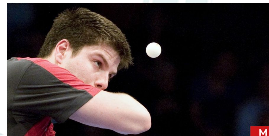
Tournoi mixte. Équipe de 2 joueurs.