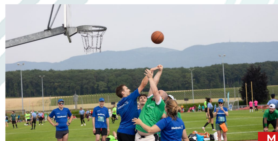
Tournoi mixte. Équipe de 4 joueurs : 3 joueurs de champ et 1 remplaçant.